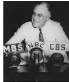
Roosevelt anunciando fin de la guerra.