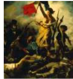
Delacroix. La libertad guiando al pueblo . s. XIX.