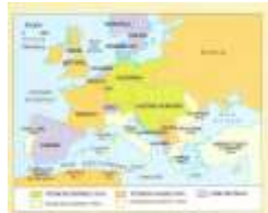
Europa en 1914.