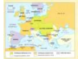
Europa en 1914.