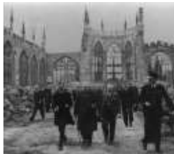
Churchill visitando ruinas de la Catedral de Coventry.