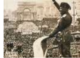
Mussolini en Roma