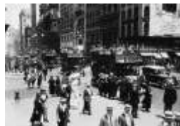
Nueva York, 1920.