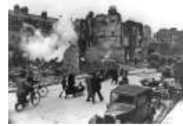
Calles del Centro de Londres (1945)