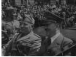
Mussolini y Hitler