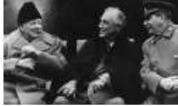
Churchill, Roosevelt y Stalin