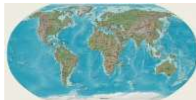
Establecimiento de las INSTITUCIONES SUPRANACIONALES