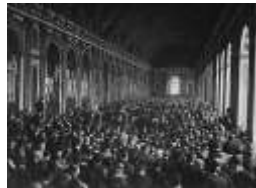
Reunión en el Salón de los Espejos Con motivo de la firma del "Tratado de Versalles". Palacio de Versalles.