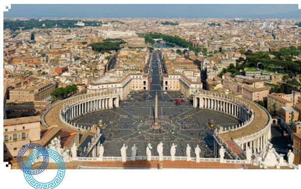
Plaza de Sn Pedro. Gian Lorenzo Bernini. 1657

Arquitectura: Aunque Roma ganó en magníficos edificios y monumentos durante el Renacimiento, también sufrió los ataques de los teólogos de la Reforma y ejércitos invasores. De acuerdo al texto Arte Barroco en Italia, (s/f) Roma también albergaba los principales centros de peregrinación religiosa y mantenía los restos de la Roma Imperial. El sistema de calles construido al azar impedía la circulación de espectadores a sus monumentos. Para remediar esta situación, el Papa Sixto V (Felice Peretti, 1585-1590) promovió su visión de "Roma in forma sideris", es decir, Roma en la forma de una estrella.