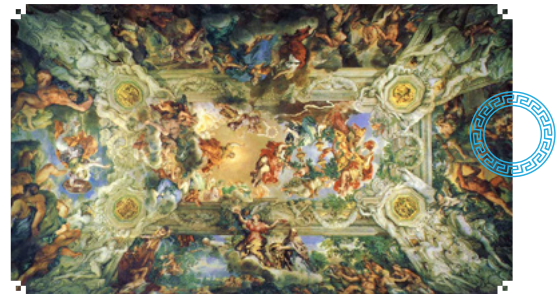
Techo del Salón del Gran Palacio Barberini de Roma

El trabajo de Lanfranco en Roma (1613-1630; en Arte Barroco en Italia, s/f) y en Nápoles (1634-1646) fue fundamental para el desarrollo de ilusionismo en Italia.