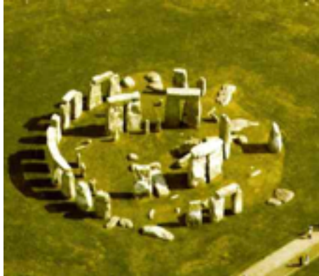
Crómlech de Stonehenge (Wiltshire, Gran Bretaña)

El crómlech: círculos formados por varios dólmenes y menhires