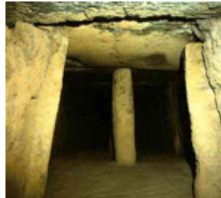
Vista interior del dolmen de la Menga, Antequera (Málaga, España)

El dolmen: se trata de un monumento formado por varios menhires sobre los que descansan horizontalmente otras grandes piedras. Muchos de estos dólmenes servían como cámara funeraria.