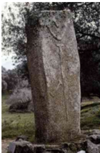
Menhir de Filitosa (Córcega, Francia)

Los principales tipos de monumentos megalíticos son: