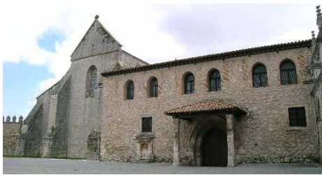
Monasterio de Burgos en España

De los obispos dependía el clero, dividido en secular y regular. El clero secular dedicaba su atención a la población, en tanto el clero regular , formado por monjes y frailes, vivían en monasterios apartados de la vida mundana y se dedicaban a la oración para alcanzar un mayor acercamiento a Dios.