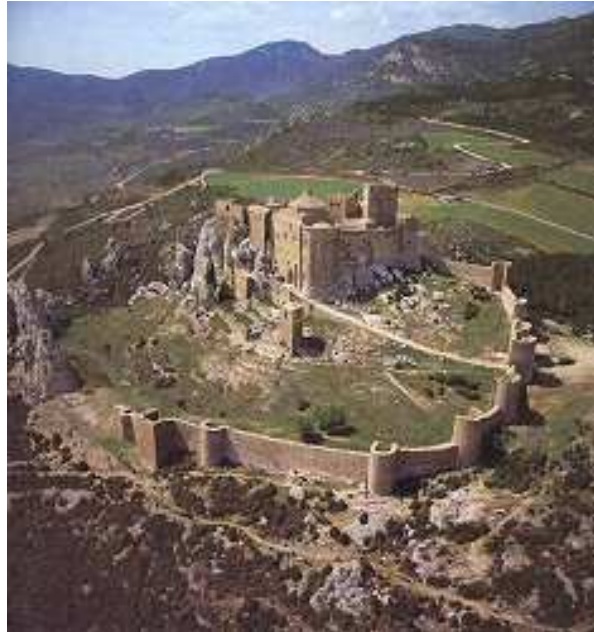
Castillo de Loarre - España

El poder de los señores se basaba en la posesión del poder de ban o bando (poder de mando), pero si bien podían exigir diversas prestaciones, el ejercicio efectivo del poder fue gracias al monopolio que tenían sobre las armas. De allí, también el deber de defensa.