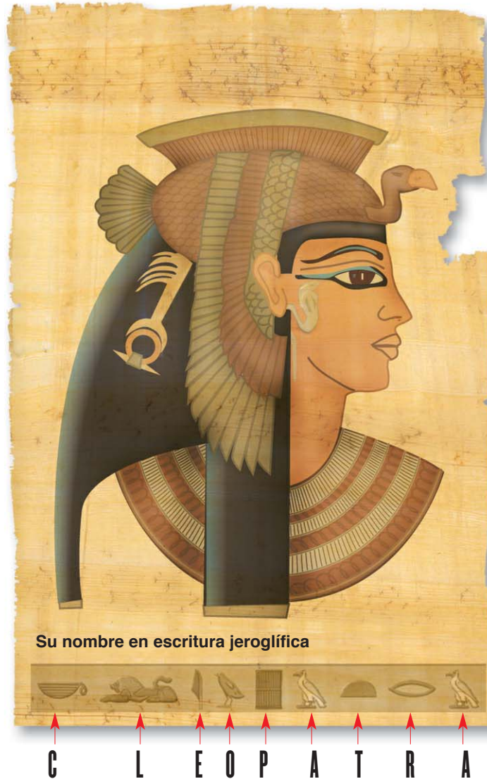
Su nombre en escritura jeroglífica

Dentro de la literatura, muchos autores han utilizado la vida de Cleopatra como base para sus creaciones. Entre sus realizaciones destacan obras teatrales como Antonio y Cleopatra (1606-1607, de William Shakespeare), Todo por amor (1678, de John Dryden) y César y Cleopatra (1901) de George Bernard Shaw.